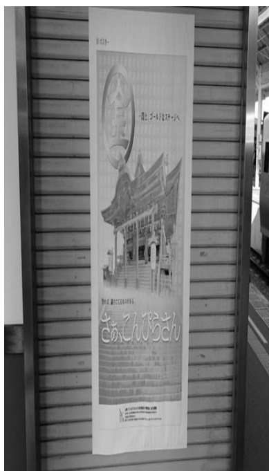
↑ 金 刀 比 羅 宮 ↑

今回は、読みやすいようにリニューアルしてみました。全国ろうあ青年部活動者会議へ行く前に金刀比羅宮へ行き、参拝してきました。山寺よりも登らなければならずとても大変でした。来年も全国ろうあ者大会へ行く前にまた金刀比羅宮へ寄って参拝しようと考えています。